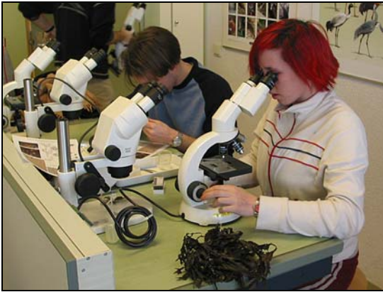
travaux pratiques de Biologie