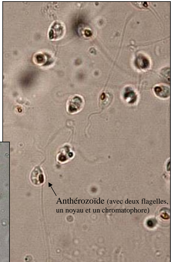
Anthérozoïde (avec deux flagelles, un noyau et un chromatophore)